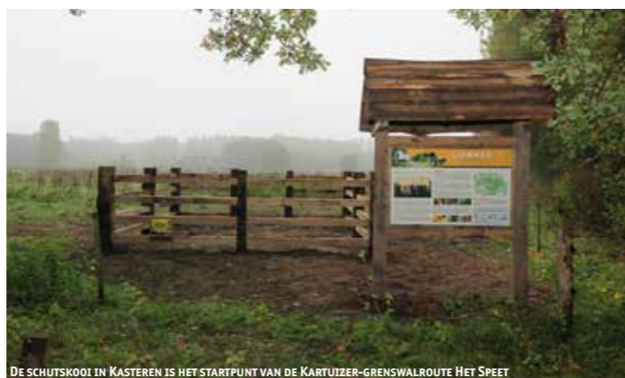
DE SCHUTSKOOI IN KASTEREN IS HET STARTPUNT VAN DE KARTUIZER-GRENSWALROUTE HET SPEET

In natuurgebied De Geelders is de Kartuizer-grenswalroute aangelegd. Een prachtige wandelroute van ongeveer drie kilometer waarbij je onderweg meer te weten komt over de historie van het gebied. Op ieder routebordje staat informatie over bijvoorbeeld grenswallen en het leven van de kartuizers. Kartuizers zijn streng gelovige monniken die in de vijftiende eeuw in dit gebied leefden. Bijzonder is dat de route ook over een originele grenswal loopt. De grenswallen in De Geelders markeerden de ontginningsblokken, ook wel kampen genoemd, die vroeger werden gebruikt voor de productie van hout of gewassen. In augustus wordt een deel van de grenswallen beplant om de zichtbaarheid te verbeteren. De route start bij de schutskooi aan de Schutstraat in Kasteren.