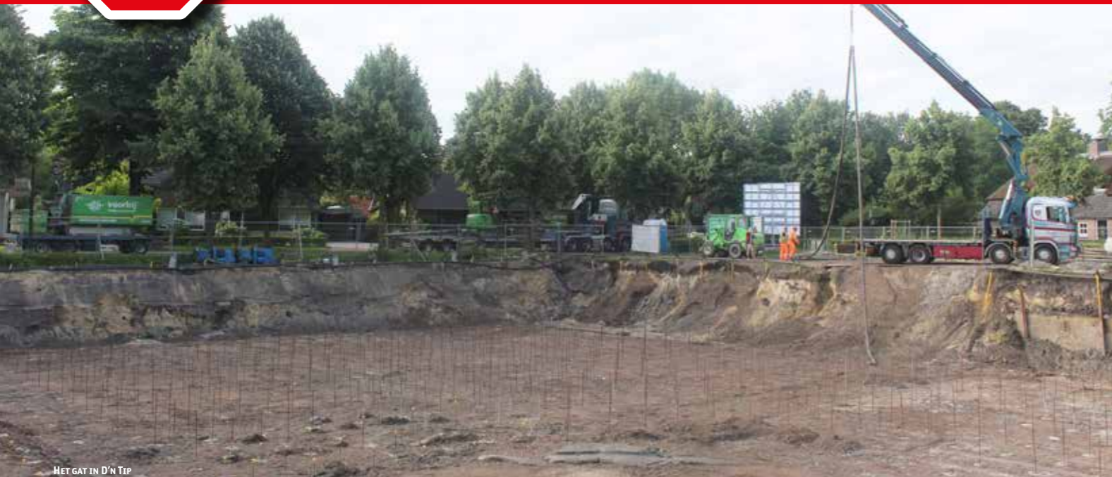
HET GAT IN D'N TIP

De projectgroep Liemt in Uitvoering heeft als doelstelling om Liempde veiliger, autoluwer, toegankelijker, gastvrij en mooier te maken voor inwoners en bezoekers. Actuele projecten zijn de herinrichting van D'n Tip en de herinrichting van het centrum.