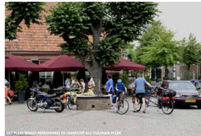
HET PLEIN WORDT PARKEERVRIJ EN INGERICHT ALS 'CULINAIR PLEIN'

Eind augustus/begin september start de herinrichting van het Liempdse centrum. De werkzaamheden zijn voor de Boeremèrt (17 april 2017) afgerond. Het centrum wordt in zijn geheel verfraaid. Het projectgebied begint grofweg bij D'n Tip en eindigt bij de kruising Nieuwstraat/Vlasspeistraat, met daartussenin het Broekegangske, het Concordiapark, 't Kaarpad en het Raadhuisplein. Daarnaast gaan ook gedeelten van de Oude Postbaan, Keefheuvel, Oude Dijk en Den Achterhof op de schop. De wegen en trottoirs worden opnieuw bestraat, de lantaarnpalen worden deels vervangen, de aanwezige parkeerplaatsen worden duidelijker herverdeeld, de wegen worden versmald, trottoirs worden breder, de toegankelijkheid voor mindervaliden wordt verbeterd en daarnaast wordt ook het Raadhuisplein opnieuw ingericht. Het plein wordt parkeervrij en ingericht als een soort 'ontmoetingsplein' (bij het oude raadhuis) en 'culinair plein' (bij Het Wapen van Liempde). Op het plein bij het oude raadhuis komt tevens de weekmarkt. Het Concordiapark krijgt de functie van 'muziekplein' en wordt in de toekomst nog beter bruikbaar voor de organisatie van activiteiten en evenementen. Bij de herinrichting maakt SPPiLL gebruik van bestaande materialen uit wegen en trottoirs.