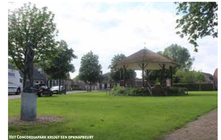
HET CONCORDIAPARK KRIJGT EEN OPKNAPBEURT

Naast de wensen van SPPiLL, zijn ook de wensen van de gemeente Boxtel in de plannen opgenomen. Vanaf D'n Tip tot aan de kruising Nieuwstraat/Vlasspeistraat wordt het riool vervangen en vergroot. Daarnaast staat gepland om het groen in het Concordiapark duurzaam te verbeteren. Twaalf kastanjabomen zijn aangetast met de kastanjabloedingsziekte en worden vervangen door lindebomen. De drie grote, monumentale kastanjabomen blijven staan (deze zijn niet aangetast). Daarnaast wordt ook het gras opnieuw ingezaaid en komen er hegjes tussen de bomen. Het park blijft inzetbaar voor evenementen als de kermis, Boeremèrt, Limuscene en Oldtimerdag.