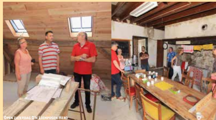
OPEN ZATERDAG D'N LIEMPSDEN HERD

Wekelijks werkt er een vaste club vrijwilligers aan de verbouwing en restauratie van de boerderij aan de Barrierweg 4. Hier opent SPPiLL in 2017 bezoekerscentrum D'n Liempdsen Herd. Het wordt een bezoekerscentrum voor de hele gemeenschap. Daarom nodigt SPPiLL alle inwoners en geïnteresseerden uit om tijdens de verbouwing alvast een bezoek te brengen. Iedere laatste zaterdag van de maand staat er van 9.00 tot 12.00 uur een open dag gepland. De eerstvolgende is op zaterdag 30 juli. Iedereen is van harte welkom voor een rondleiding en een kop koffie. Vanwege de vakantieperiode staat er in augustus geen open zaterdag gepland.