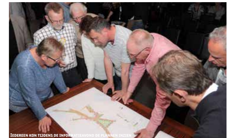
Iedereen kon tijdens de informatieavond de plannen inzien