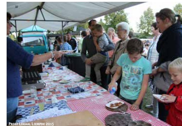
PROEF LOKAAL LIEMPDE 2015