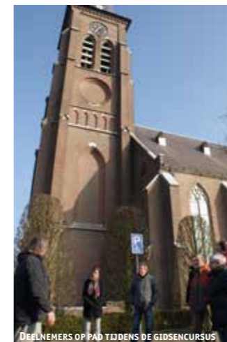
DEELNEMERS OP PAD TIJDENS DE GIDSCURSUS