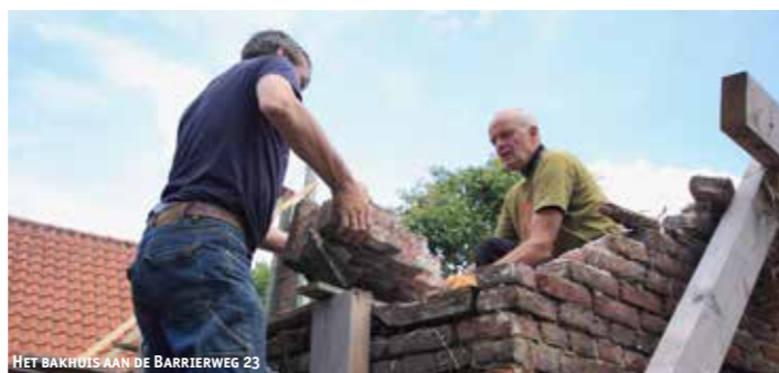
HET BAKHUIS AAN DE BARRIERWEG 23