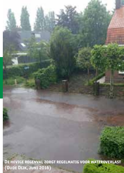
DE HEVIGE REGENVAL ZORGT REGELMATIG VOOR WATEROVERLAST (OUDE DIJK, JUNI 2016)

In september van dit jaar start SPPiLL in samenwerking met gemeente Boxtel en waterschap De Dommel een nieuw project, namelijk een project om regenwaterafvoeren van huizen af te koppelen van de riolering. Gestart wordt in een pilotgebied in het centrum van Liempde. De urgentie om af te koppelen is de afgelopen maanden met diverse vormen van wateroverlast nog eens bevestigd.