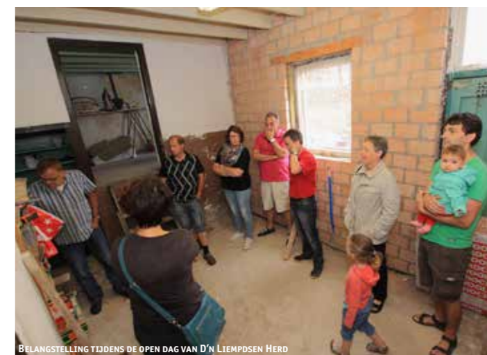
BELANGSTELLING TIJDENS DE OPEN DAG VAN D'N LIEMPSDEN HERD