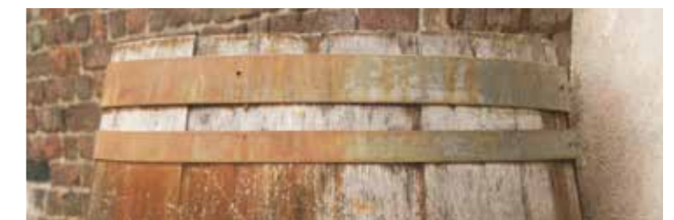
HET PLAATSEN VAN EEN REGENTON IS ÉÉN VAN DE VELE MANIEREN OM REGENWATER AF TE KOPPELEN

Heb je interesse om hieraan mee te werken? Meld je dan voor 16 november aan via info@sppill.nl . Vermeld hierin je naam, je telefoonnummer en stuur hierbij een voorbeeld van je eigen werk.