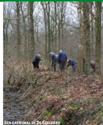
EEN GRENSWAL IN DE GEELDERS