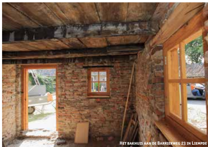
HET BAKHUIS AAN DE BARRIERWEG 23 IN LIEMPE

Op zaterdag 22 oktober heeft een club enthousiastelingen van onder meer Stichting Brabantse Bronnen, Natuurwerkgroep Liempde en SPPiLL een gedeelte van de grenswal in natuurgebied De Geelders aangeplant. Dit met als doel om de oorspronkelijke begroeiing van de grenswal terug te brengen en het historische landschap van De Geelders te herstellen en beleefbaar te maken. De beplantingswerkzaamheden zijn uitgevoerd na aanbevelingen van Ecologisch Adviesbureau Maes. Het rapport, dat gaat over de historische inrichting en beplanting van de grenswal, is eerder dit jaar uitgegeven en te downloaden van de website ( www.sppill.nl ). De grenswallen zijn eeuwenoud en worden met dit project weer extra onder de aandacht gebracht bij voorbijgangers. Uit onderzoek, dat in 2014 en 2015 als onderdeel van het project is uitgevoerd, blijkt dat het zeer aannemelijk is dat de grenswallen in de tweede helft van de dertiende eeuw zijn aangelegd. Vanaf de schutskooi bij De Geelders start een route van ruim één kilometer die grotendeels op de aanwezige grenswallen loopt. Langs de route zijn diverse informatiepaneeltjes geplaatst met informatie over de grenswallen en het gebruik van het gebied.